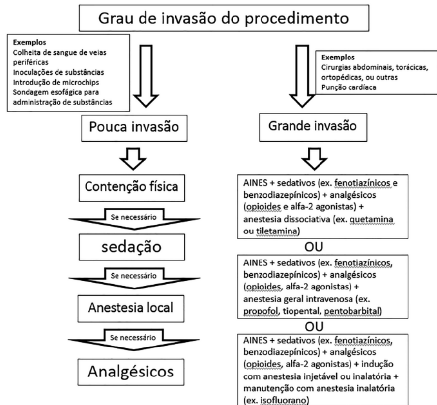
Figura 1 - Exemplo de opções de controle da dor classificadas de acordo com o potencial do procedimento em resultar dor ou estresse ("grau de invasividade"). AINES: Anti-inflamatórios não esteroides