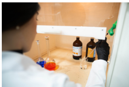
Laboratório de praticas da disciplina de Bromatologia